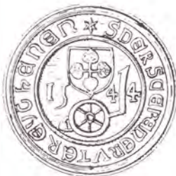
Afb. 6 uiterst rechts