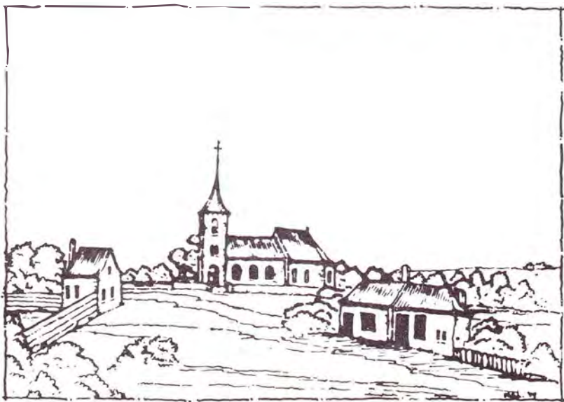
Afb. 8: De R.K. kerk in Rosmalen

De ellende bleef zich opstapelen. Hoog water opnieuw in bijvoorbeeld 1795. De overleden dominee Adrianus Laurentius werd met een slee over het ijs naar de Lambertuskerk gebracht. Die kerk stond gedeeltelijk vol met paarden en beesten omdat het dorp "ingelopen" is.