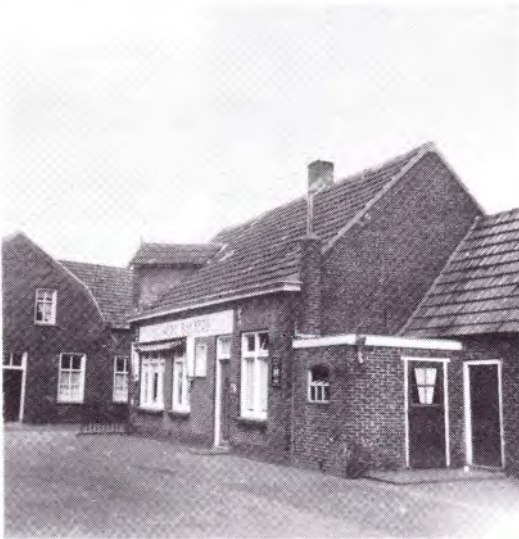
Bakkerij G.C. de Werd anno 1960. Gret de Werd kocht dez bakkerij annex woonhuis, winkel, café en stallingen in 1935 voor f 9500,-. Het pand werd in 1908 gebouwd door baker Antoon Kuipers.

- "Ingevalle er bij weederom brengen disput tusschen den bakker en den terugbrenger van het voorschreeve brood mogt valle of het al zoo waare als art. 17 gemeld is zal de bakker gehouden sijn provisioneel het geld aan de terugbrenger te voldoen dan indien den bakker vermeent dat het brood goed is zal hij ingeval hij zulks gerade vind den terugbrenger voor scheepenen van Rosmalen kunnen citeeeren om dezelve tot aanneeming van het