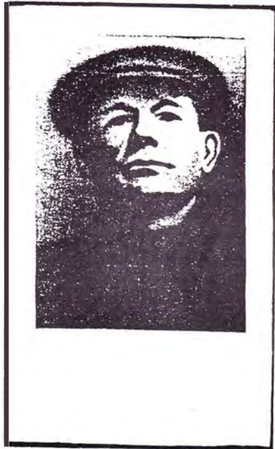
Bidprentje van Cornelis van Stiphout.