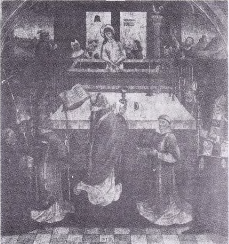
"Gregorius" - Paneelschildering (eikenhout) uit Vlaamse school. 15e eeuw. Afkomstig van Coudewater. Coll. Rijksmuseum.