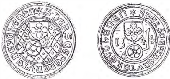
Zegels uit 1481: S. der Scepenen uten Eyghenen (links) en 1544: S. der Scepenen uter Eyghenen (rechts). Vergelijk de ploeg in het wapen van Rosmalen.

Een naam als Heeseind verwijst dus naar een gebied gelegen aan een weg, hier een dijk, aan de grens (=eind) van een grote(re) nederzetting/dorp (=Rosmalen of Nuland). Het was wellicht het verst afgelegen gebied dat voor ontginning, en derhalve voor bewoning, geschikt geacht werd 52 . Het eerste deel in de naam van dat afge-