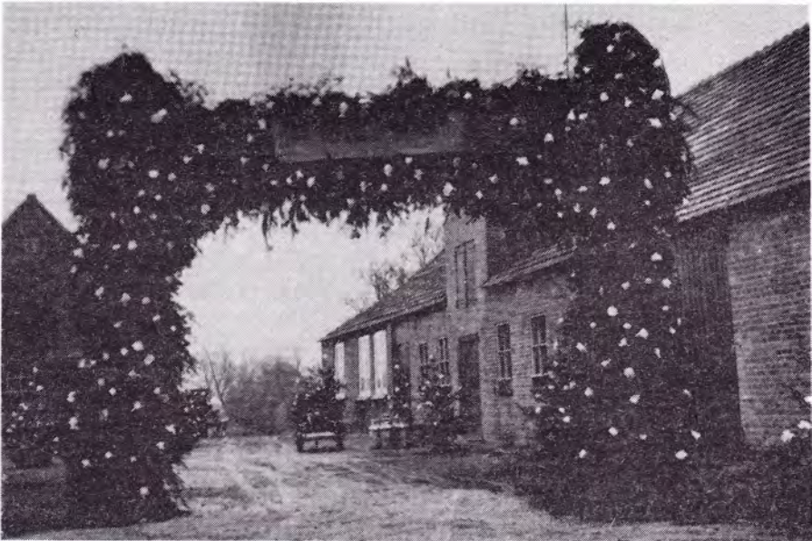
1967: Hulde aan de neomist. Een fraaie ereboog bij de ouderlijke boerderij aan de Maliskampsestraat.