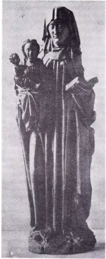
St. Anna te Drieën. 's-Hertogenbosch, eind 15e eeuw. Afkomstig van het klooster Coudewater. Coll. Rijksmuseum, Amsterdam.