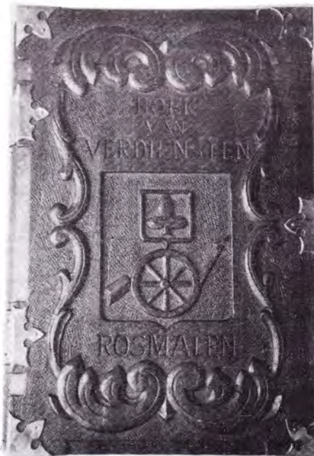
De fraaie houten omslag van Het Boek van Verdiensten.