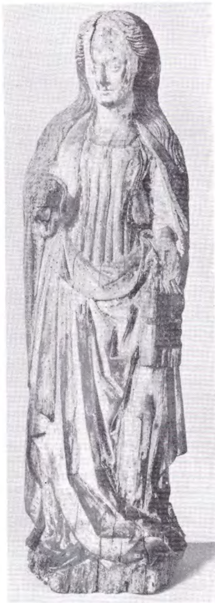
Vrouwelijke heilige, derde kwart 15de eeuw. Afkomstig van klooster Coudewater. Coll. Rijksmuseum, Amsterdam.