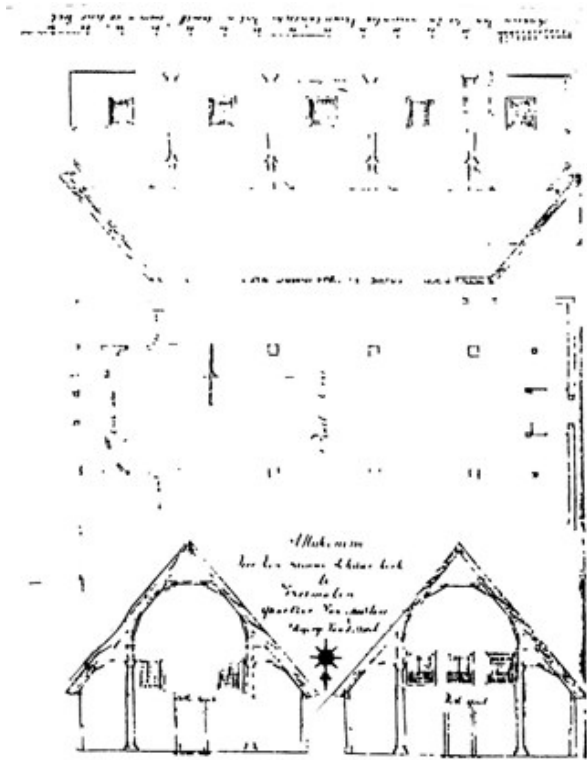
afb. 41, cat.nr. 7