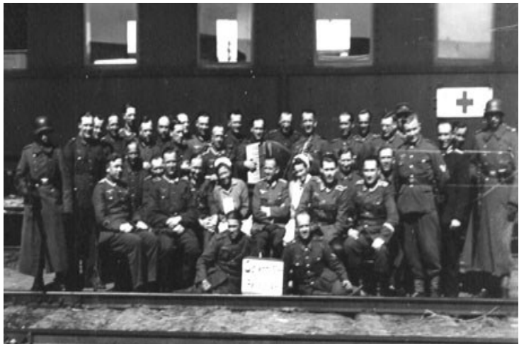
Artsen, verpleegsters en bewaking van de Rode Kruis trein.