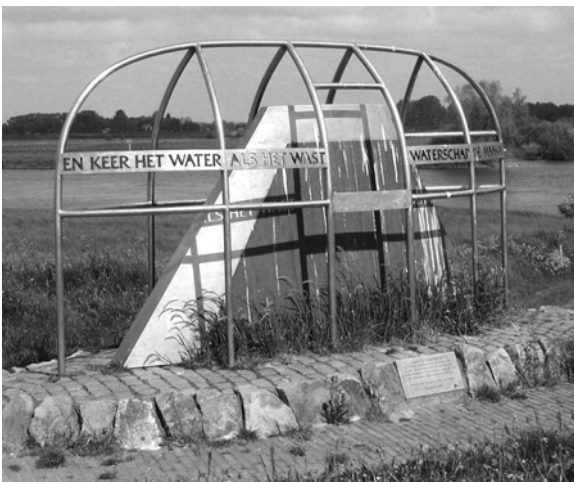
Gedenksteen op de Empelsedijk in Empel

Rosmalen ligt vlak bij de noordgrens van de Provincie Noord-Brabant. Hierdoor werd het dorp vroeger vaak bedreigd door de Gelderse soldaten (omstreeks de Middeleeuwen). Bovendien was Den Bosch een belangrijke vestingstad en deze plaats beheerste de noordelijke toegangswegen tot het hertogdom Brabant, vandaar dat de omgeving van Den Bosch vaak door militairen werd “bezocht”. Dit was vaak nadelig voor het dorp. Pas sinds 1942 is er een eind gekomen aan de overstromingen mede door het afsluiten van de Beerse Overlaat (openingen in de Maasdijk om het overtollige water te lozen op het Maasland). Daarom werd het Maasland pas zo laat economisch en landbouwkundig te ontwikkelen. ( In de perioden hieraan voorafgaand zag je alleen maar weilanden .Doordat de kans groot was dat de polder zowel in voor- als najaar, soms beide, onder water kwam te staan, kwam akkerbouw om die reden niet in aanmerking.