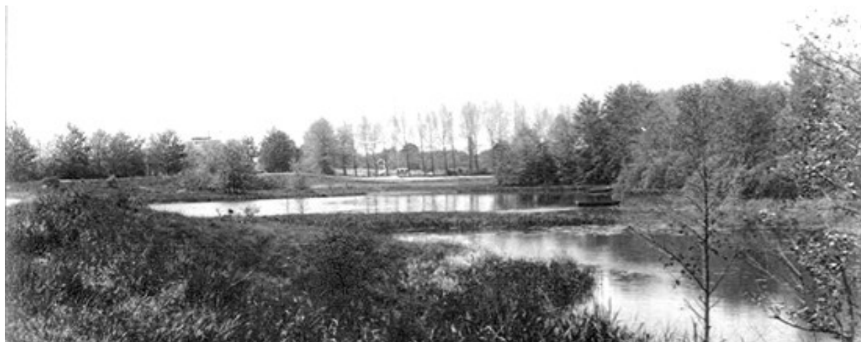
De Heilige Geestwiel, een van de vele wielen op d'n Heinis. omstreeks 1970

In grote lijnen beschrijft hij de geschiedenis van Rosmalen, waarvan vele dingen wel bekend zullen zijn, maar andere zeker niet. In kort bestek kun je in ieder geval kennis nemen, zij het in grote lijnen, van ons dorp vanaf 1815 tot op heden, wie de schrijver van dit artikel ook moge zijn.