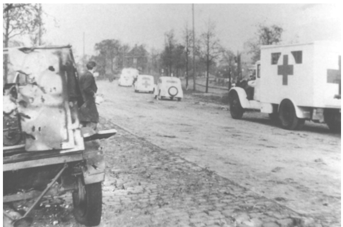
Ambulances van het Rode Kruis vervoerde de gewonden uit de trein naar de diverse ziekenhuizen