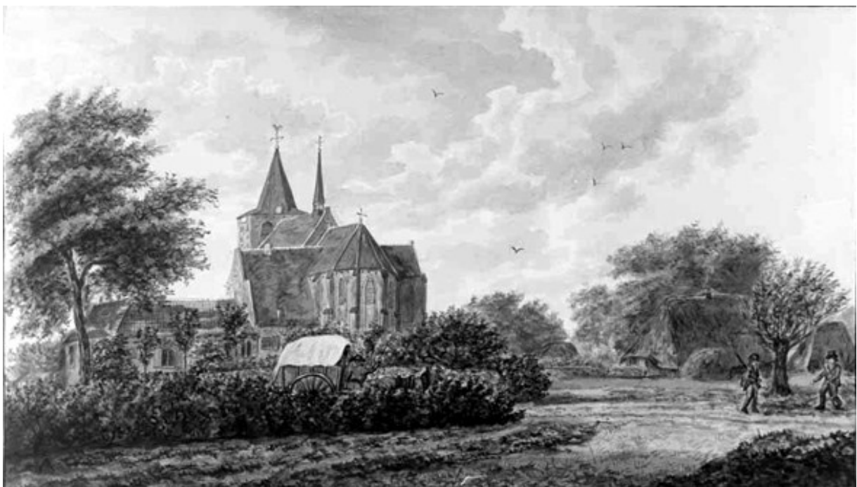
Een prachtige prent van het Rosmalense centrum in 1872 gemaakt door Joseph Knip