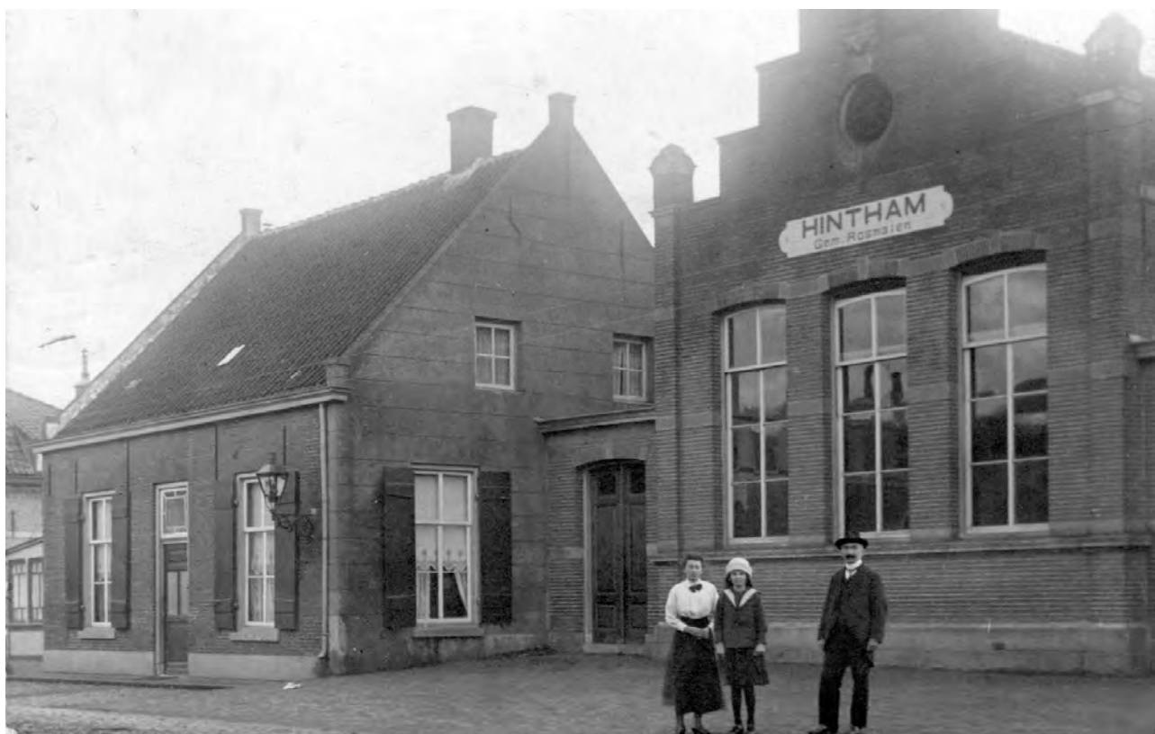
Het oude schoolhuis van Hintham.