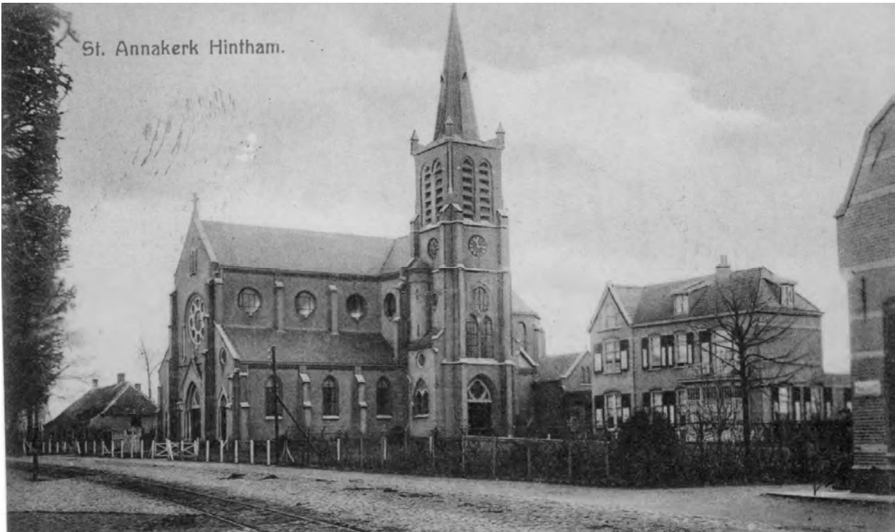
Oude prentbriefkaart van de Annakerk in Hintham. We zien links de rails van de tramweg, die van Den Bosch naar Veghel liep.