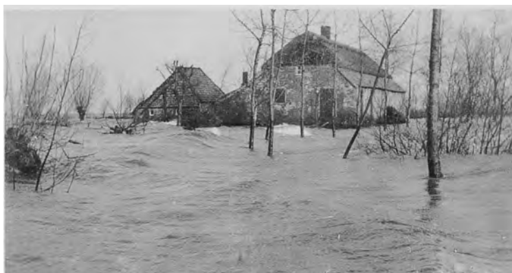
Overstroming op De Heinis

's Winters bij hoog water en een harde wind zoals bv. in 1920 en 1926, ja dan kon het ellendig zijn en veel boerderijtjes werden dan een prooi van de golven zeker wanneer alles onverwachts gebeurde bij een dijkdoorbraak. Als getuige van deze plotselinge doorbraken zien we nog enkele "wielen" langs de maasdijk