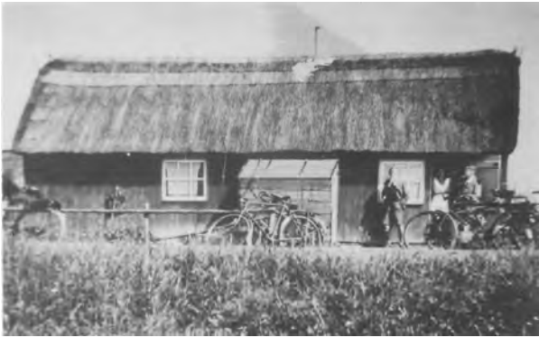
De hut van Koelewijn in de Rosmalense polder